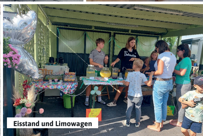
Eisstand und Limowagen