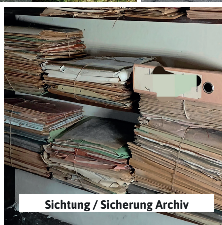
Sichtung / Sicherung Archiv