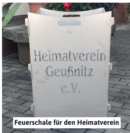
Feuerschale für den Heimatverein